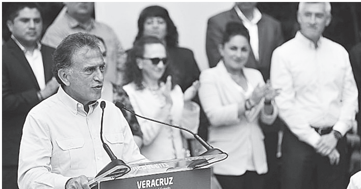
YUNES LINARES ABUNDÓ que en el caso del adeudo de la Universidad Veracruzana (UV) con el SAT, ya se tiene un convenio para que sea el Gobierno del estado quien asuma el pago.