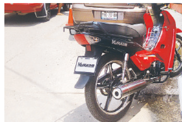
LOS MOTOCICLISTAS se ven en la necesidad de circular sin placas en la ciudad.

las autoridades tendrían una idea de cómo se encuentran geográficamente el municipio; sin embargo, no se le ha dado la importancia.