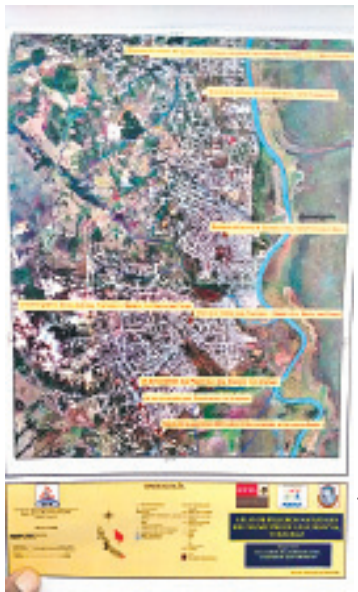
DESDE HACE MÁS DE TRES AÑOS, no se actualiza el atlas.

Se trabajará en la formación de brigadas comunitarias para que en coordinación con las autoridades municipales,