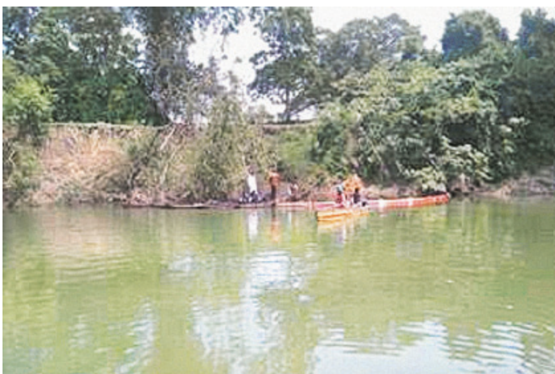
LOS TRABAJOS DE CONTENCIÓN y limpieza se realizaron en tiempo y forma.

Sin embargo, nuevamente se registró otro acto vandálico en las barreras que fueron removidas, procediéndose a su reemplazo para continuar con los trabajos de contención