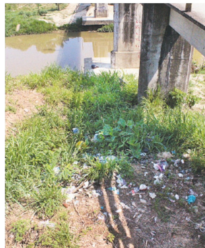
LA BASURA SIGUE SIENDO tirada a la orilla del río Agua Dulce.

Se espera que las autoridades estatales emitan cuanto antes la remesa de placas que son prioritarias para las unidades, pues los motociclistas y automovilistas se muestran preocupados por dicha situación.