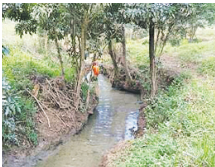
EL HIDROCARBURO fue recolectado por el personal de Pemex.

Asimismo Pemex presentó las denuncias correspondientes ante las autoridades de la Conagua