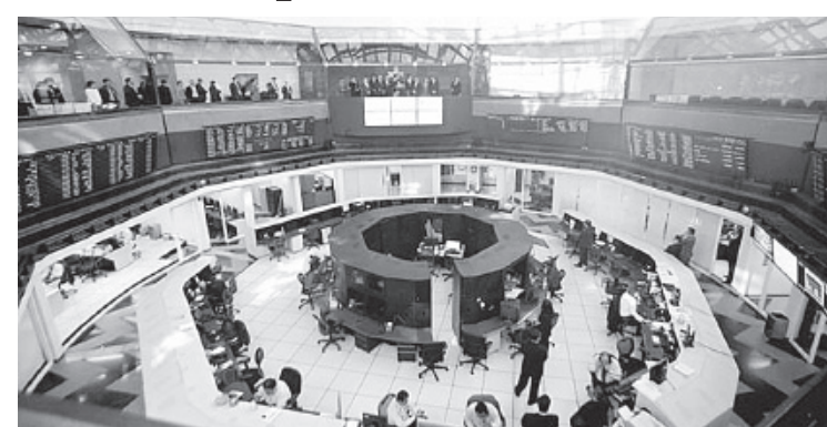
EL ÍNDICE DE PRECIOS y Cotizaciones, principal indicador accionario, se ubicó en 48 mil 622.24 unidades, un descenso de 425.71 enteros respecto al nivel previo.

Al cierre de la sesión, en la BMV se operó un volumen de 298.4 millones de títulos por un importe eco-