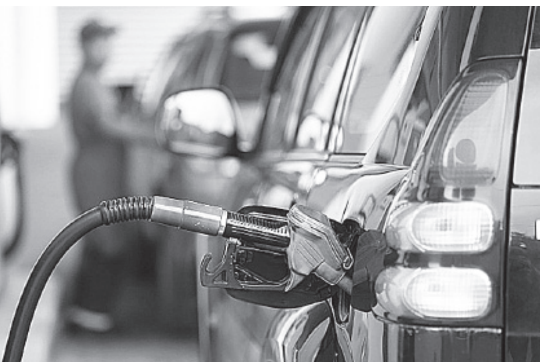
TANTO EL SAT como Pemex cuentan con información de los controles volumétricos, es decir, el producto que compra y vende cada una de las gasolineras.

García Elizondo confirmó que se han registrado casos de amenazas y extorsiones a em-