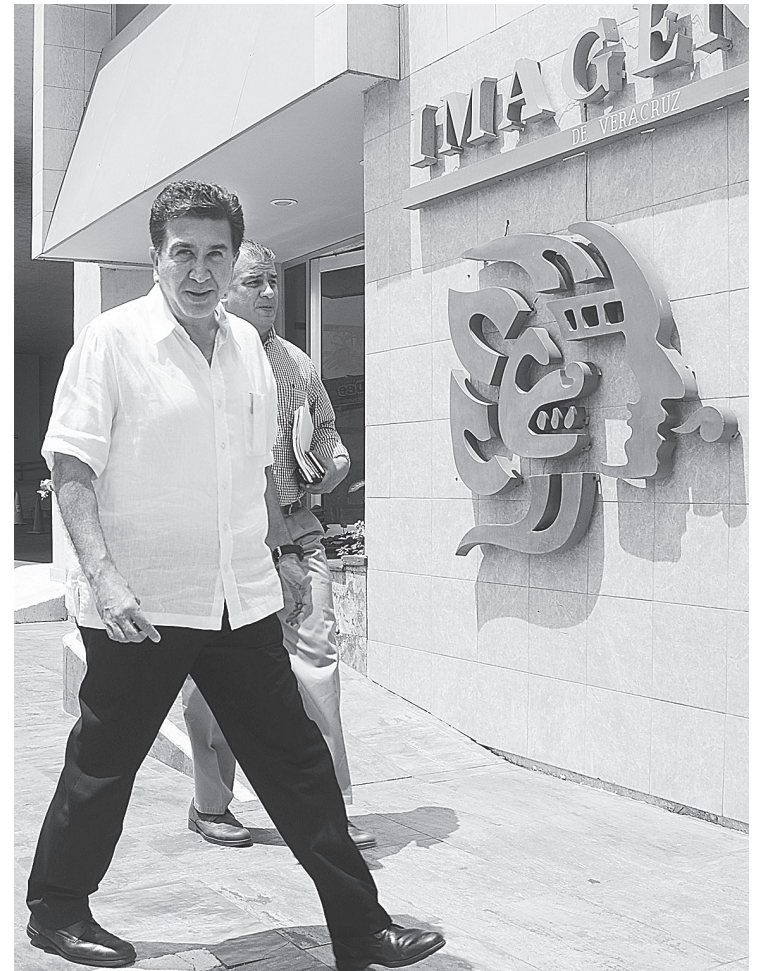
PIE DE FOTOT, pie de fotot.

“Ayer tuve oportunidad de platicar con el secretario de gobierno, me comentó algo dramático, cómo han dado golpes a bandas en diferentes partes del estado, donde se da el robo de combustible, se han desarticulado bandas de secuestradores, está en esfuerzo de echarlos para atrás, todo este fenómeno que vive Veracruz, no hubiera sido posible sin la indolencia o complicidad de las anteriores autoridades, del ex procurador, y ex gobernadores”, concluyó.