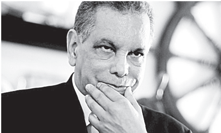
NAVARRETE COMENTÓ que “no ve al exmandatario que se pasee mucho en Veracruz, a menos que traiga unos seis amparos en la bolsa”.

XALAPA, VER.