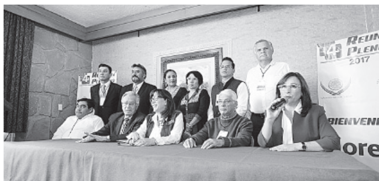
ACTUALMENTE EL GRUPO PARLAMENTARIO de Morena está integrado por 39 legisladores y con la adhesión de los seis expperredistas serán 45.

El grupo parlamentario de Morena en la Cámara de Diputados, que se reúne para realizar su plenaria, se consolidará como la cuarta fuerza política en San Lázaro, luego de que seis diputados del PRD de distintas corrientes abandonaron su partido y se sumaron al que dirige Andrés Manuel López Obrador.