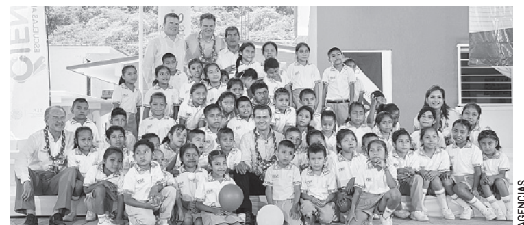
EL PRESIDENTE ENCABEZÓ la ceremonia oficial por el inicio del Ciclo Escolar 2017-2018 en Aquismón, San Luis Potosí.

“Lo que tiene vigencia es lo que está en nuestra Constitución y claramente este fue el sentido de la Re-