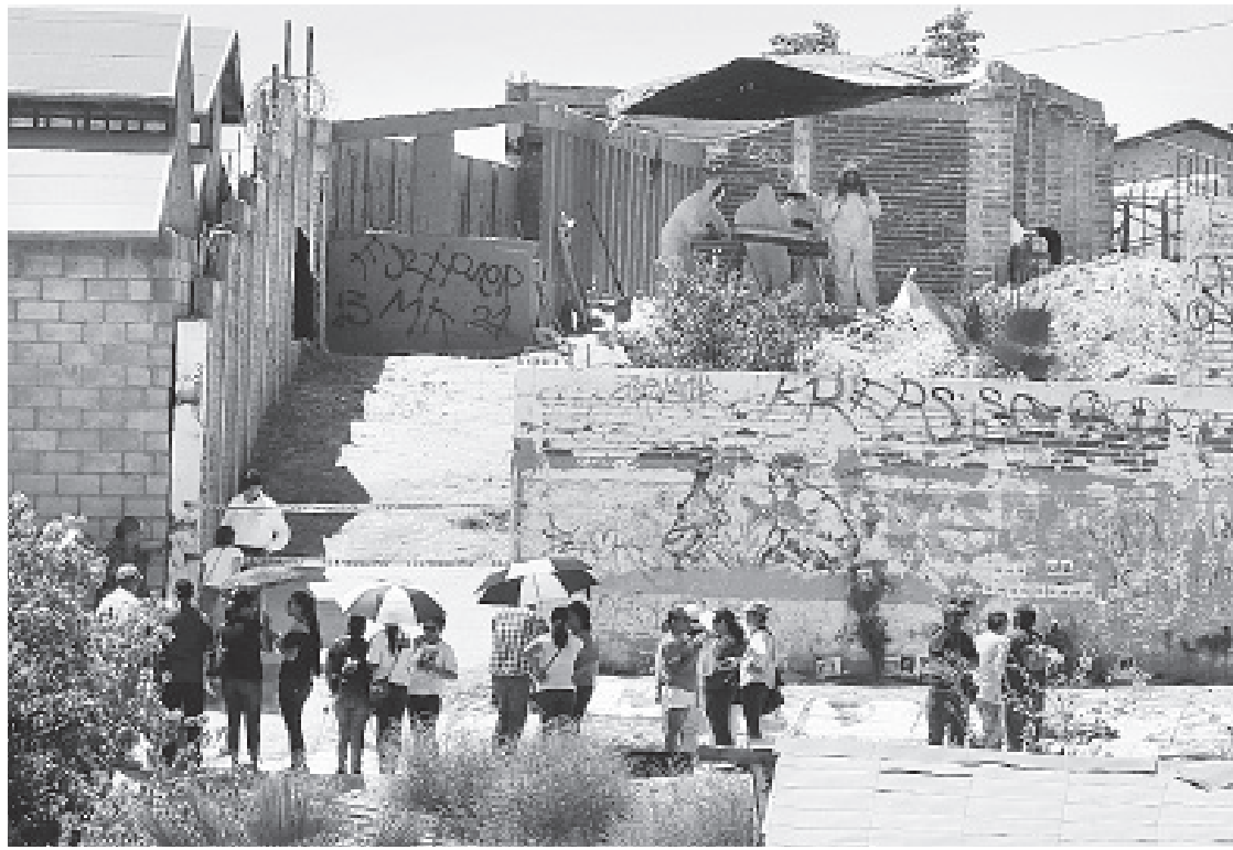
FRENTE A LA AUSENCIA DEL ESTADO en la búsqueda de los desaparecidos, los familiares se han organizado en brigadas de búsqueda ciudadana.

En el II Foro México Seguridad sin guerra. Una lectura desde las víctimas y la academia—convocado por la Unidad Iztapalapa de la Universidad Autónoma Metropolitana (UAM), la Unión Europea y la citada Red—añadió que la magnitud de la crisis humanitaria que vive el país “sólo se entiende por la corrupción política, la impunidad y la falta