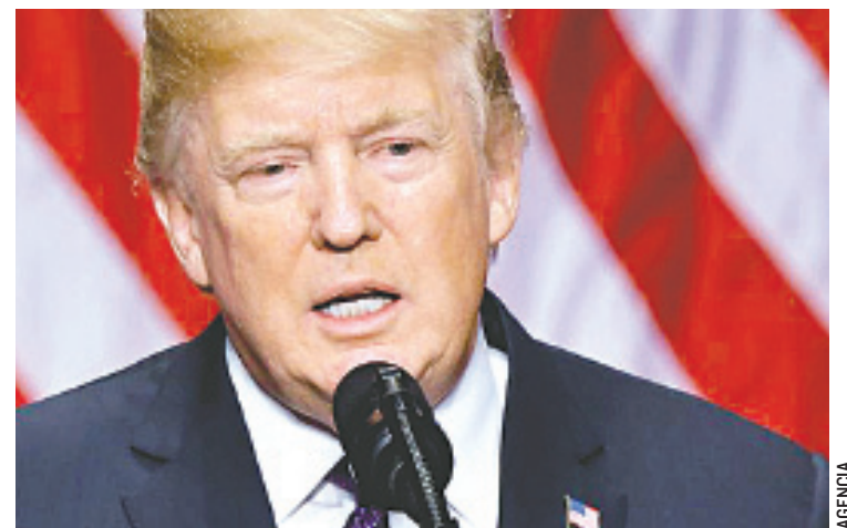
EL PRESIDENTE DE ESTADOS UNIDOS, volvió a sacar su lado más racista para referirse a los países africanos, Haití y El Salvador, calificándolos de "países de mierda".

de aquí'. Inventado por demócratas. Tengo una relación fantástica con los haitianos". Sin embargo, a los pocos minutos, el senador demócrata Richard Durbin, que asistió a la reunión, insistió en que el presidente sí utilizó la expresión "países de mierda" y también hizo "comentarios de odio, racistas y malvados". El embajador de Haití en EE