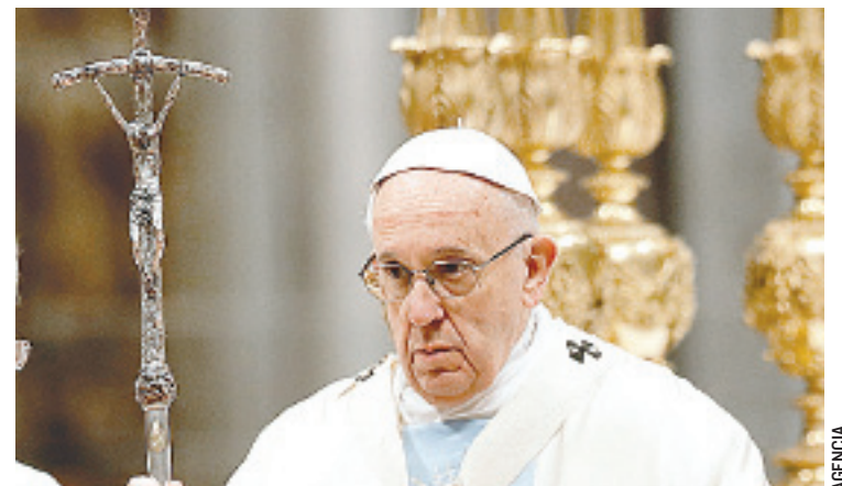
CHILE, A DONDE FRANCISCO arribará el lunes, es el país de América Latina donde el Pontífice y la Iglesia Católica tienen la peor valoración.

Al filtrar las respuestas conforme la religión que