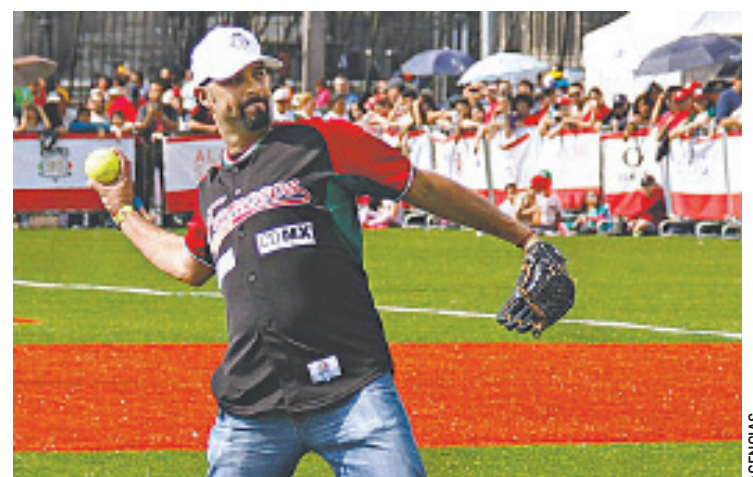
LA DROGA ASEGURADA a Esteban Loaiza está valorada en 500 mil dólares.

El pitcher diestro mexicano ganó 126 juegos en Grandes Ligas, y entre los lanzadores mexicanos solamente es supe-