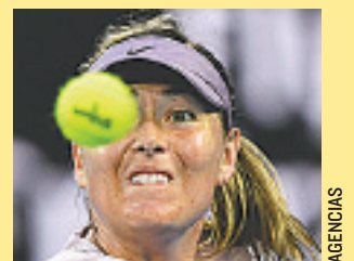
MARÍA SHARAPOVA fue eliminada a la primera.