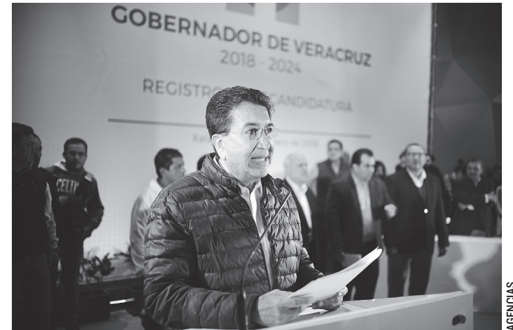
HÉCTOR YUNES ACUSÓ al gobernador Miguel Ángel Yunes Linares de no respetar a los poderes por igual.