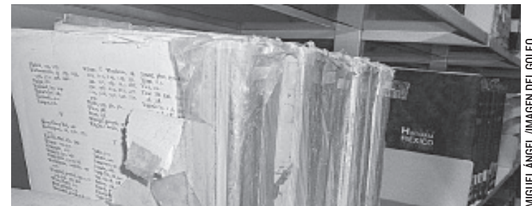
EL 10 POR CIENTO DEL ACERVO cultural se encuentra dañado por las condiciones climáticas.

Morales de los Santos se encuentra buscando alternativas para mejorar las condiciones de los libros y estos puedan seguir siendo útiles a los lectores.