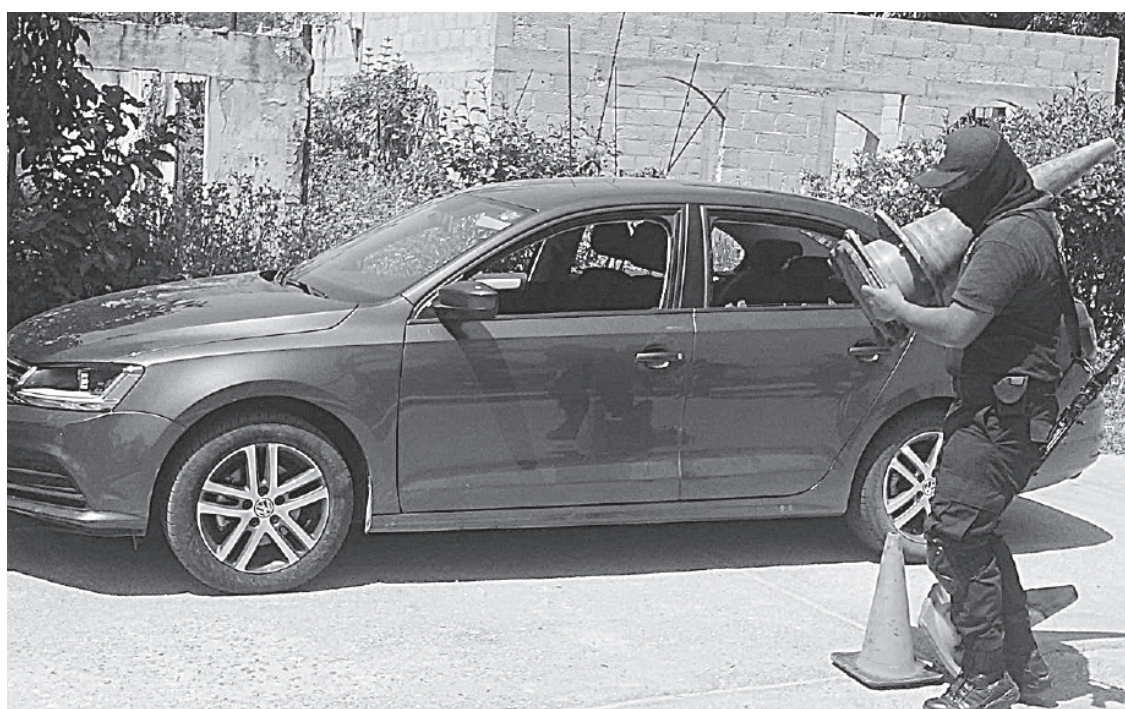
ERAN EX POLICÍAS MUNICIPALES de Las Choapas y Agua Dulce los que integraban la banda que realizaba extorsiones y robo de autos en el Paralelo.

Hasta el momento, la Fiscalía General del Estado se encuentra integrando las averiguaciones con las denuncias que al menos tres personas interpusieron en contra de la banda integrada por los ex policías, por lo que en las próximas horas éstos podrían ser trasladados al Cereso.