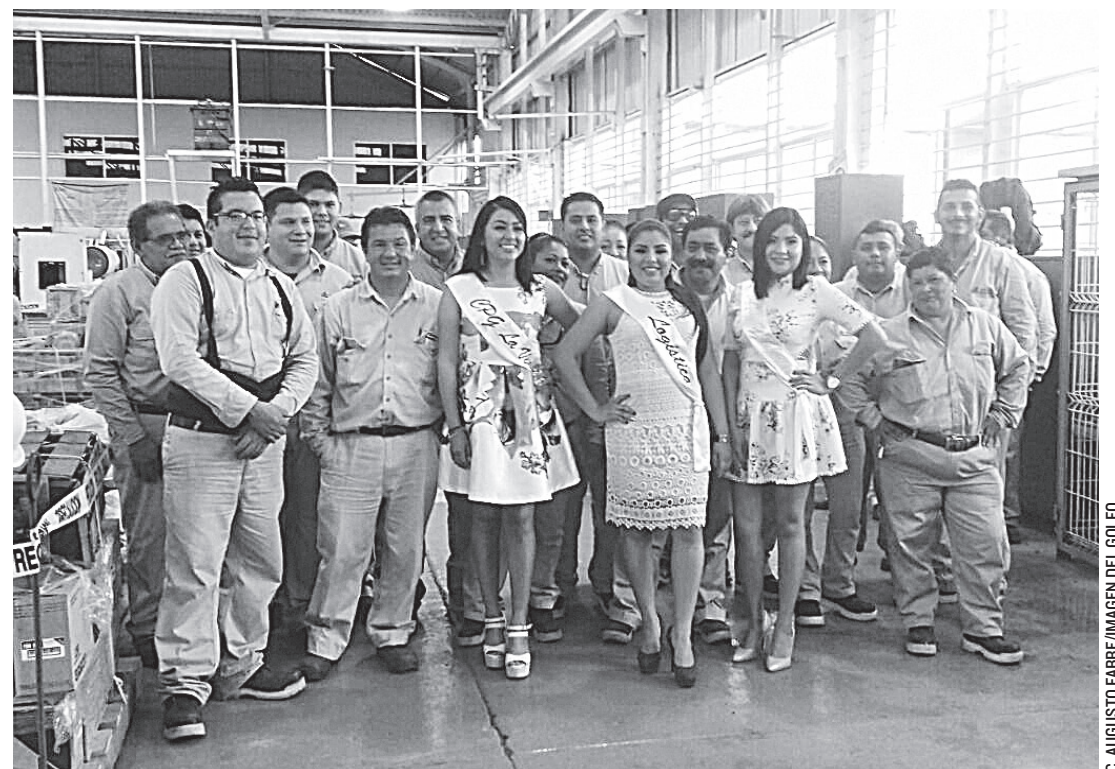
EL VOTO SERÁ SECRETO y hoy miércoles 14 se dará a conocer a quien gane estas elecciones de embajadora petrolera.