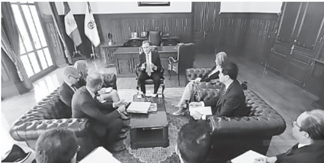
LOS EMBAJADORES DE DINAMARCA, Noruega, Finlandia, y Suecia se reunieron con periodistas y familiares de personas desaparecidas en Xalapa para conocer la situación de la prensa y los derechos humanos en Veracruz.