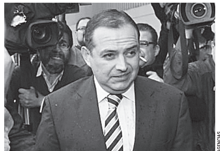
LA UNIDAD ANTILAVADO de la PGR da entrada a la denuncia del senador para investigar si el candidato presidencial cometió operaciones con recursos de procedencia ilícita.

El presidente del Senado dijo que respeta y aprecia a Calderón, pero que sus decisiones son por convicción. “El panismo no debe ponerse al servicio de la impunidad. El que haya corruptos en los demás partidos no implica que tengamos un candidato deshonesto en el PAN, la mejor vía siempre será el estado de derecho”, replicó.