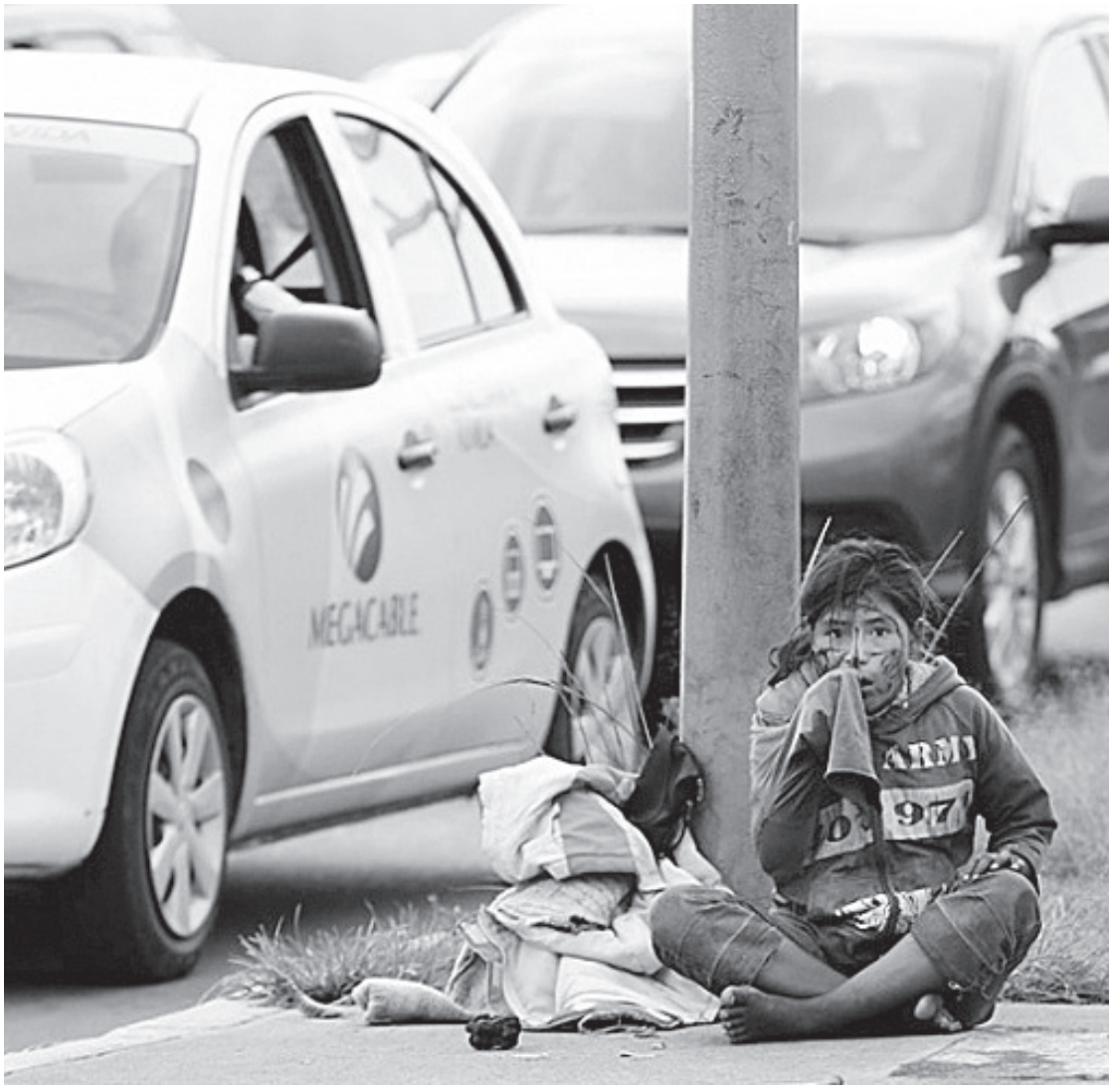
NAYARIT ES LA ENTIDAD con la tasa más alta de trabajo infantil con 19.7%

Durante 2017, la tasa de trabajo infantil fue más alta en localidades con menos de