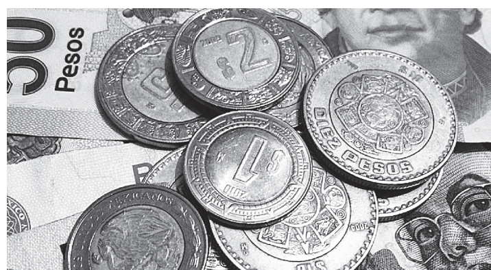
LA MONEDA COTIZABA a 20.39 por dólar, con una ganancia de 0.68% o 13.90 centavos, frente al 20.529 de referencia de Reuters del martes.

kín respondió con un plan para imponer tarifas a cientos de productos estadounidenses, acercando a las dos mayores economías del mundo a la guerra comercial.