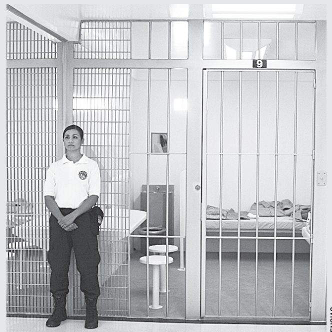
FAMILIARES DE LOS REOS podrán depositarles como máximo 2 mil 100 pesos para que puedan comprar lo que se venden en los Ceferesos.

Figueroa Velázquez aseveró que la iniciativa está vinculada con la gobernabilidad en los Ceferesos y tiene “varias vertientes de control hacia la seguridad”, ya que con la entrega de tarjeta de débito a los presos se pretende que dejen de manejar dinero en efectivo en los Ceferesos porque implican relaciones de poder o vertientes de autogobierno “que hay que ir apagando para ir ganando terreno y que la autoridad pueda ser respetada y obedecida en los términos que la propia ley establece”.