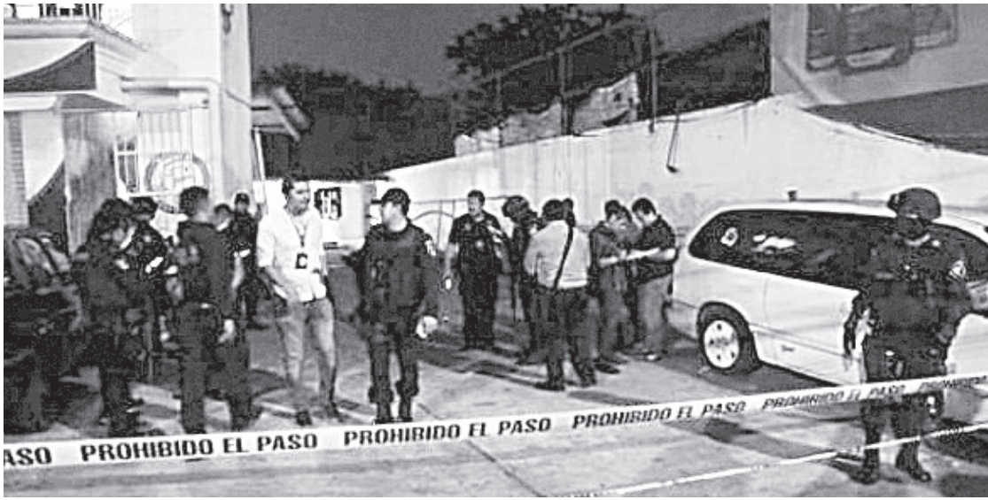
UN ATAQUE ARMADO EN EL ANTRO 'Madame' dejó seis muertos, en 2016.