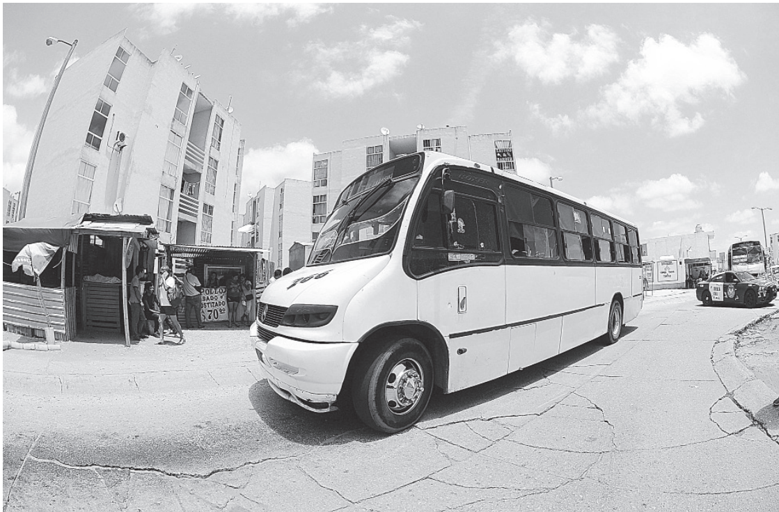
EL ATAQUE AL CHOFER de este autobús ocurrió en el fraccionamiento Santa Martha.

Paramédicos de la Cruz Roja y Cruz Ámbar, trasladaron al chofer y ayudante a un hospital donde su estado de salud es reportado como grave.