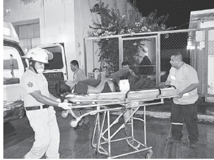
PC ACAYUCAN AUXILIÓ a menor de 15 años de edad, quien fue atacado a balazos.

Por las heridas que presentaba en brazos, piernas y abdomen, este hombre murió la noche del miércoles en el nosocomio de este puerto, donde fue identificado por sus familiares ante las autoridades ministeriales, para después ser trasladado a Minatitlán donde sería sepultado.